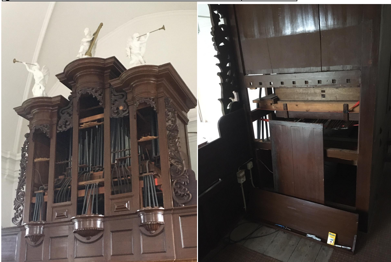
Pijpen uit het orgel verwijderd en van het klavier is niets te zien.